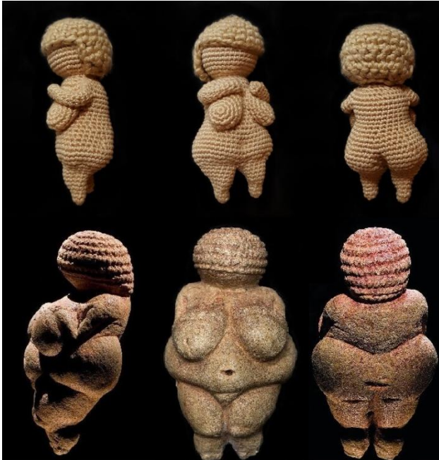
Abbildung 2: Die Häkel-Willendorf-Venus im Vergleich zur Original Willendorf Venus

Damit die Häkel-Venus der Original Willendorf noch ähnlicher sieht, habe ich mit Hilfe eines neuen Fadens einen Bauchnabel fest eingenäht und zusätzlich noch das Bauch- und Kniefett betont.